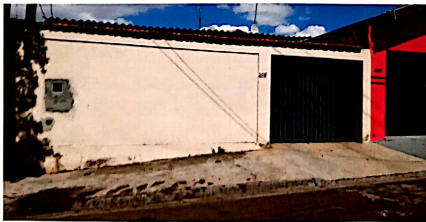
Foto Fachada Imóvel

CPD/Inscrição Municipal – 1241930 - Setor 17, quadra 0445, Lote 0030 (Certidão Valor Venal Anexo)